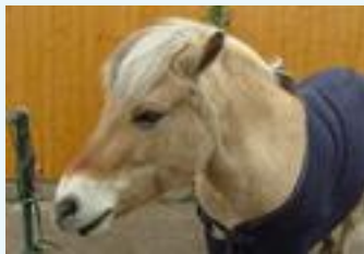
Bella, Norwegerstute Jahrgang 1992