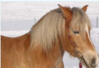
Wasti, Haflingerwallach Jahrgang 1998