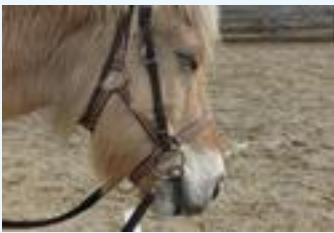
Olegro, Norwegerwallach Jahrgang 1991

Jahrgang 1952 Schreinermeister und Gestalttherapeut AKG